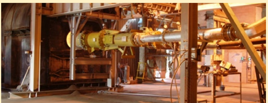
Mitmekanaline põletid "Unitherm" vedelate ja tahkete alternatiivkütuste põletamiseks