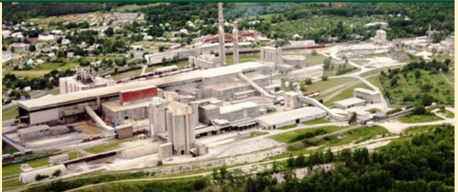
Kunda tsemenditehas linnulennult

AS-i Kunda Nordic Tsement kahele tsemendipöördahjule paigaldati tahke jäätmekütuse kaitlussüsteem: ladu ja vastuvõtuseadmed, transpordi- ja toitesüsteem, dosaatorid, põletid ja automaatjuhtimisseadmed. Dosaatorseadmetest kannab surnuõhk peenestatud jäätmekütuse põletitesse. Kütuseosakesed põlevad ca 2000 °C temperatuuriga leegis täielikult. Tahkete jäätmekütuste (RDF, Hot-Mix, SLF jt) ladustamiseks on ehitatud kinnine laohoone koos vastuvõtupunkriga, paigaldatud kin-