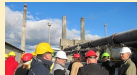
EKJA liikmed KNT pöördahju taustal Keskkonnaamet – lüli seadusandja ja ettevõtete vahel

Majandussurutis on mõjunud KNT toodete müügile nii Eestis kui ka välismaal. Kui 2008.a. töötas tehas veel täisvõimsusel, siis külastuse hetkel oli töös vaid 1/3 tehasest ehk üks kolmest tsemendipõletusahjust. Toodete turustamisel on probleemiks ka konkurendid Lätist, kes pakuvad oma tooteid odavamalt hinnaga, kuid ka madalama kvaliteediga.